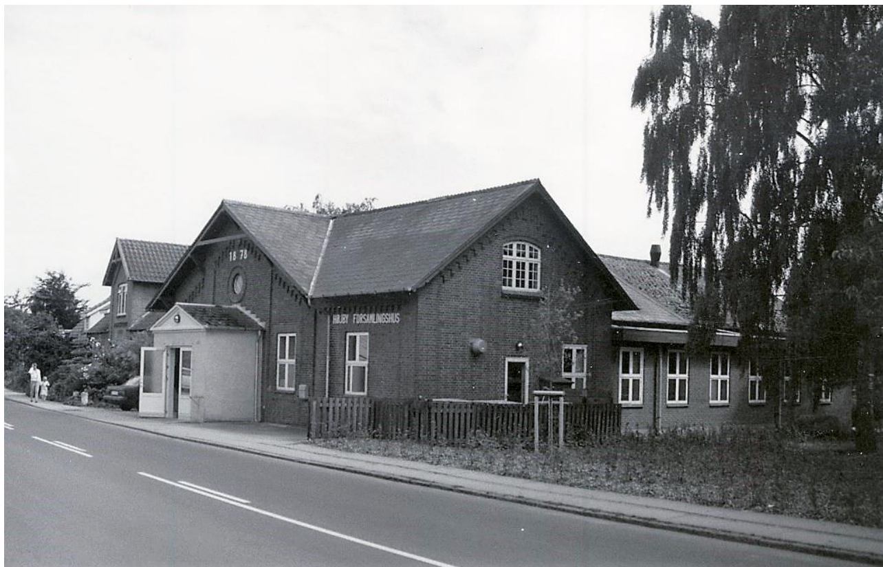
Forsamlingshuset fotograferet i 1997 - Huset bagved er den tidligere skomager Ærenlunds hus som igennem mange år lagde jord til parkering. – Højby Lokalhistorisk Forening

Det var aftalt med kommunen, at de ville give et kommunalt tilskud hvert år, således at foreningerne ikke skulle betale for leje af lokale såfremt der var gratis adgang. – Ligeledes skulle skolen have lokaler til skolekomedier.