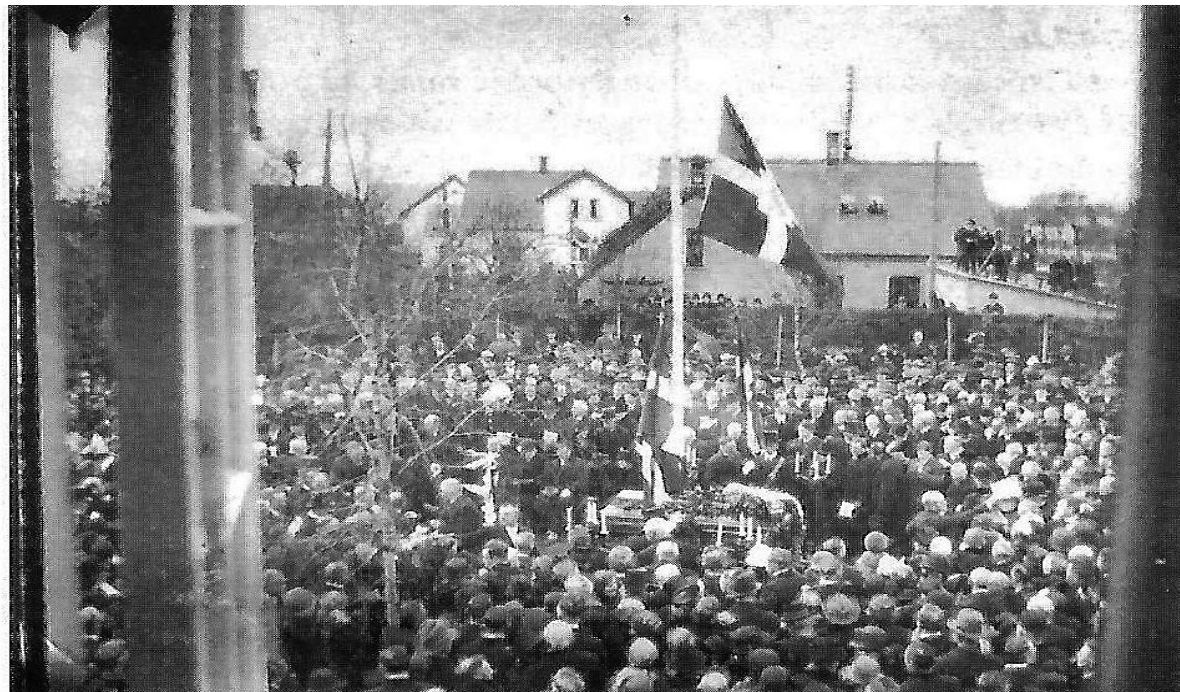
Ifølge Nationaltidende var ca. 10.000 mennesker mødt op til jordfæstelsen