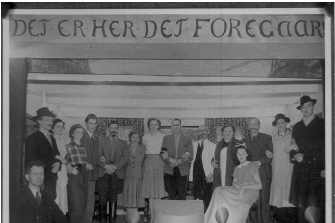
Dilettantforestilling på scenen i forsamlingshuset ca. 1951 - Højby Lokalhistoriske Forening