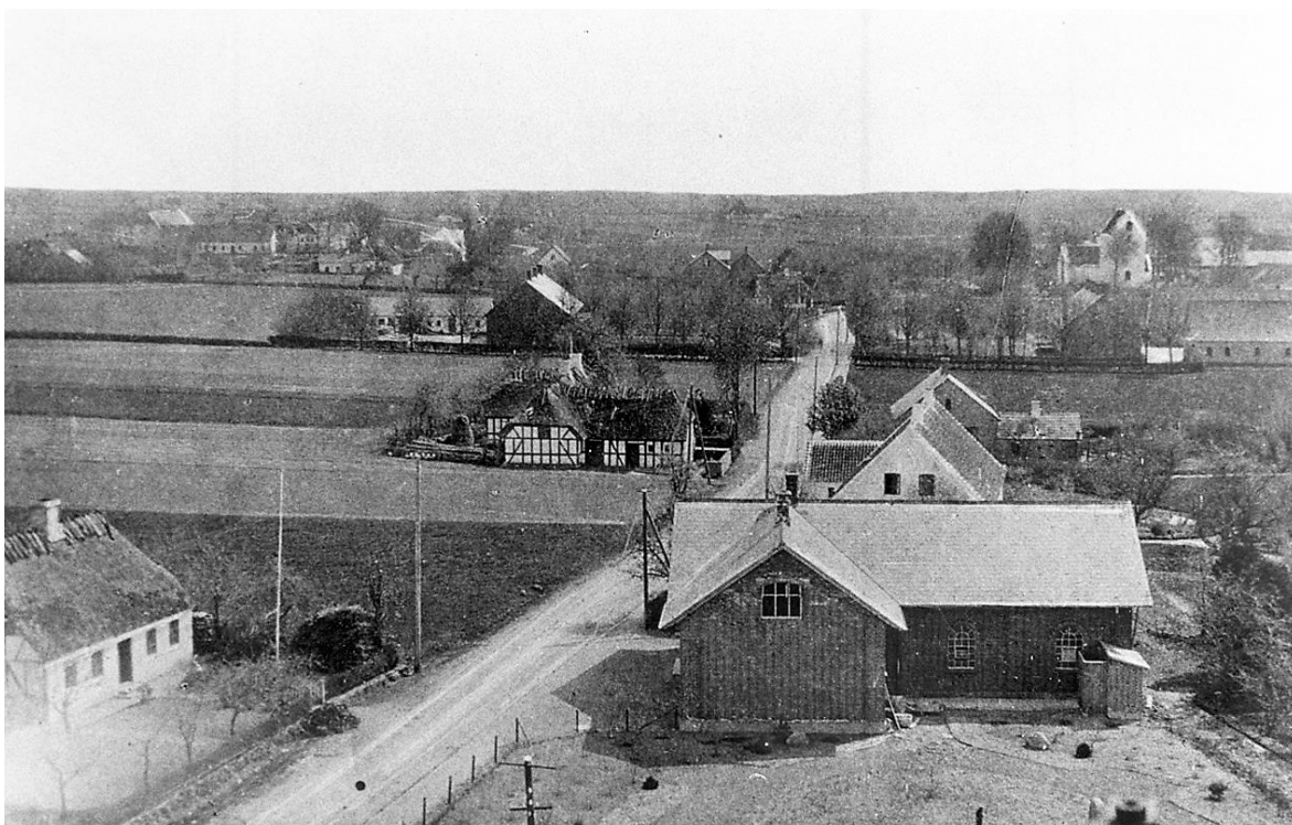
Et af de ældste fotos af Højby Forsamlingshus ca. 1909