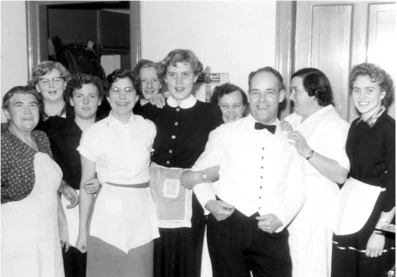
Personalet stiller op til fotografering i 1956