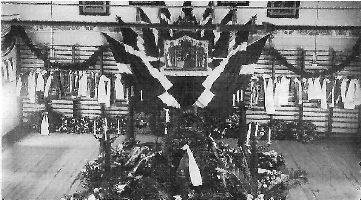
Båren i forsamlingshuset